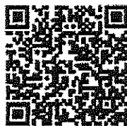
แบบรับรองข้อมูล